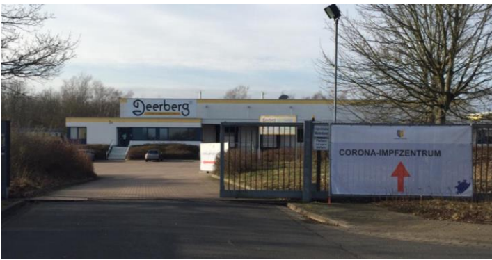
Eingang zum Corona-Impfzentrum in Lüneburg