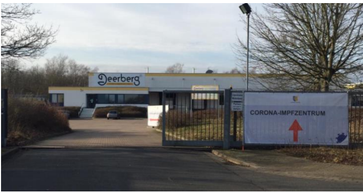
Eingang zum Corona-Impfzentrum in Lüneburg