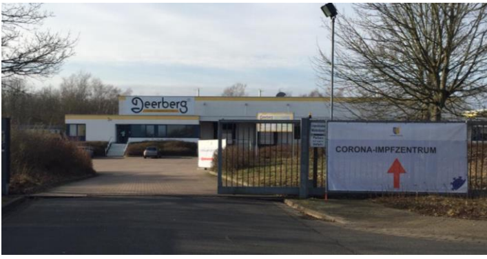
Lüneburg'daki Koronavirüs Aşı Merkezi'nin girişi